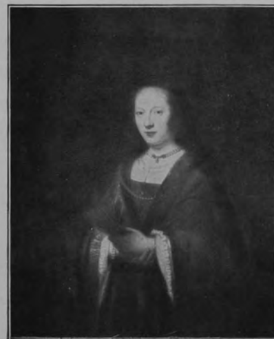
29256 REMBRANDT VAN RIJN.