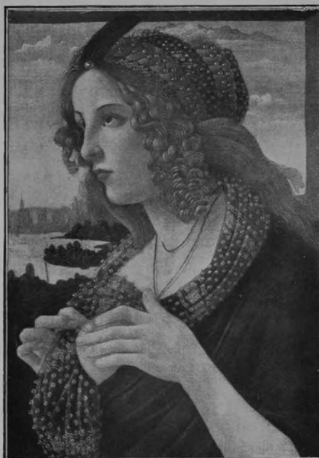
29080 SANDRO FILIPEPI dit BOTTICELLI.