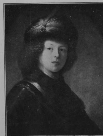
29257 REMBRANDT VAN RIJN.