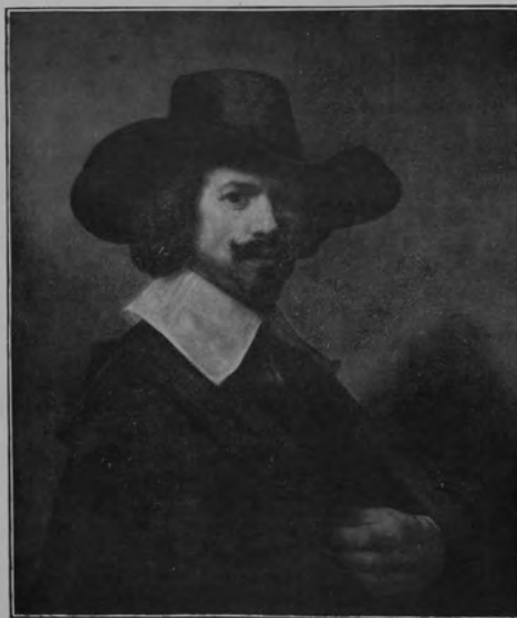
29252 REMBRANDT VAN RIJN.