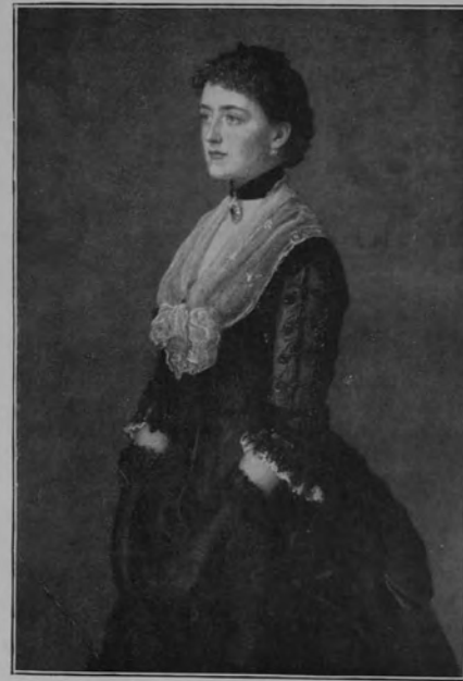
29288 JOHN MILLAIS.