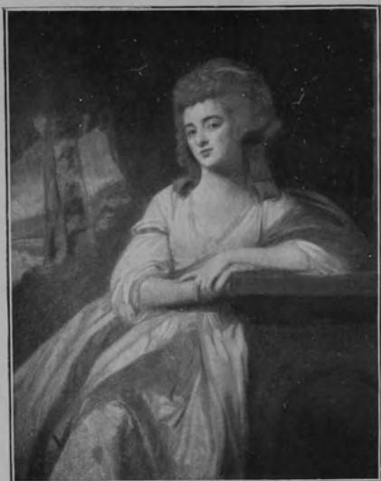
29349 GEORGE ROMNEY.