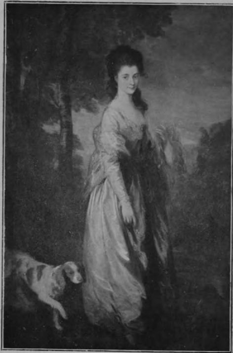
29342 THOMAS GAINSBOROUGH.