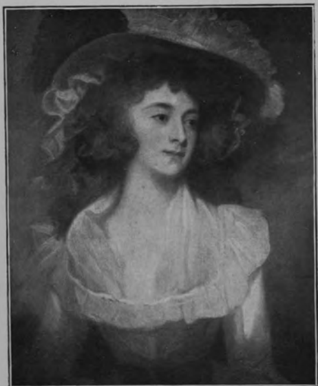
29350 GEORGE ROMNEY.