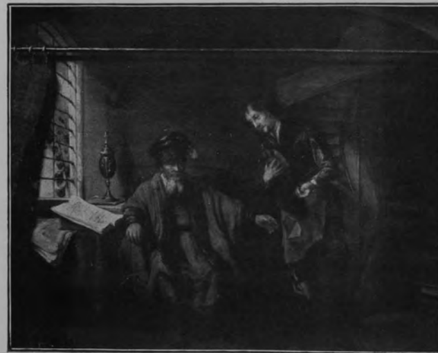
29111 REMBRANDT VAN RIJN.