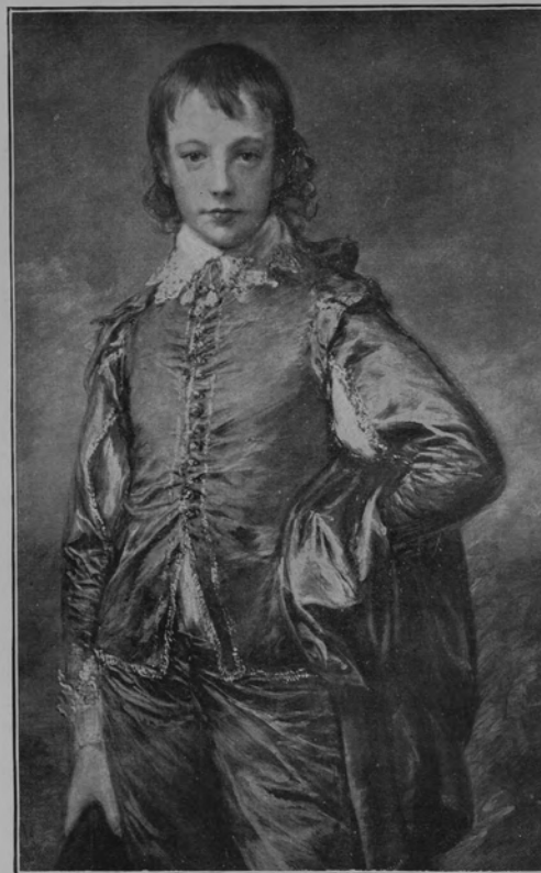
29285 his THOMAS GAINSBOROUGH.