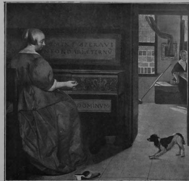
29095 GABRIEL METSU.