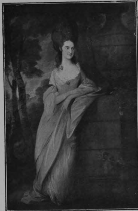
29343 THOMAS GAINSBOROUGH.