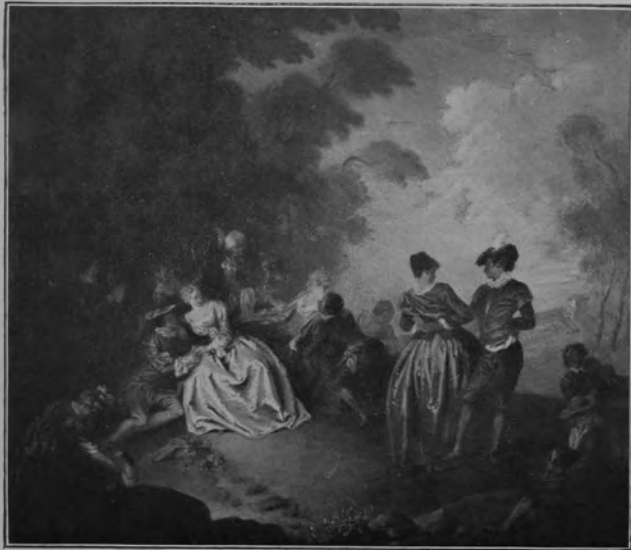
29334 JEAN-BAPTISTE PATER.