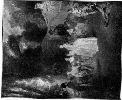
37297 ANT. WATTEAU