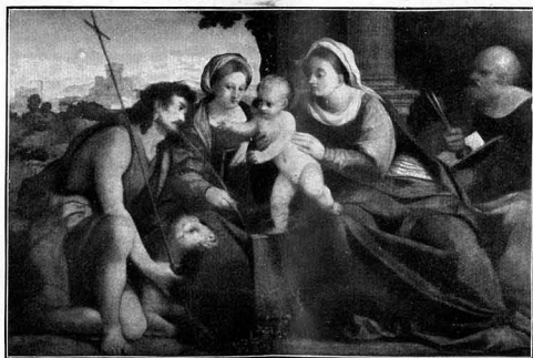
REMBRANDT VAN RIJN