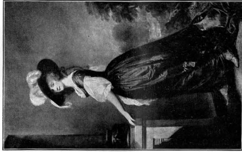
37298 GEORGE ROMNEY