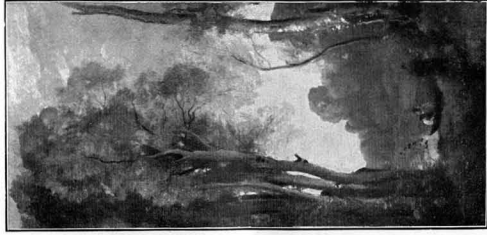
37266 JEAN-BAPTISTE COROT